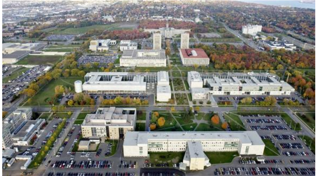
On the Université Laval campus In the Sainte-Foy/Sillery/Cap-Rouge district, in the heart of the city